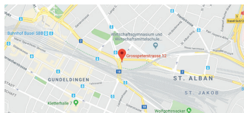
Ort: NOVOTEL, Grosspeterstrasse 12, Basel